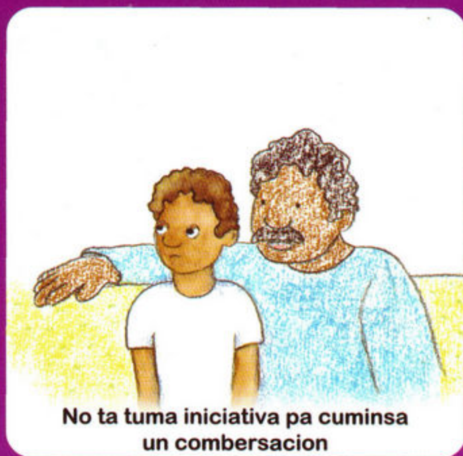
No ta tuma iniciativa pa cuminsa un combersacion